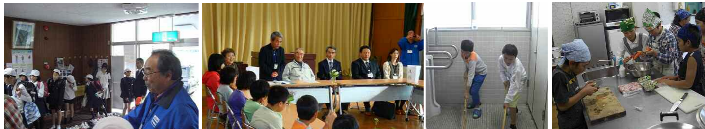
みんな元気に下校してきました

今年も阿用小学校の5年生、6年生を対象に通学合宿を行いました。7月に二泊三日で実施する予定でしたが、台風の影響で延期し、10月16日(木)17日(金)に一泊二日で実施しました。5年生が男子4人、女子5人、6年生が男子5人、女子2人で合計16人全員が参加しました。