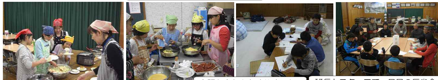
宿題もきちんとやりました。