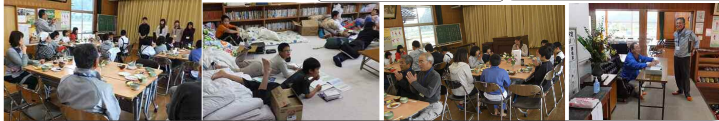
島大生4人もスタッフとして参加しました 夜は楽しくてなかなか寝られませんでした!