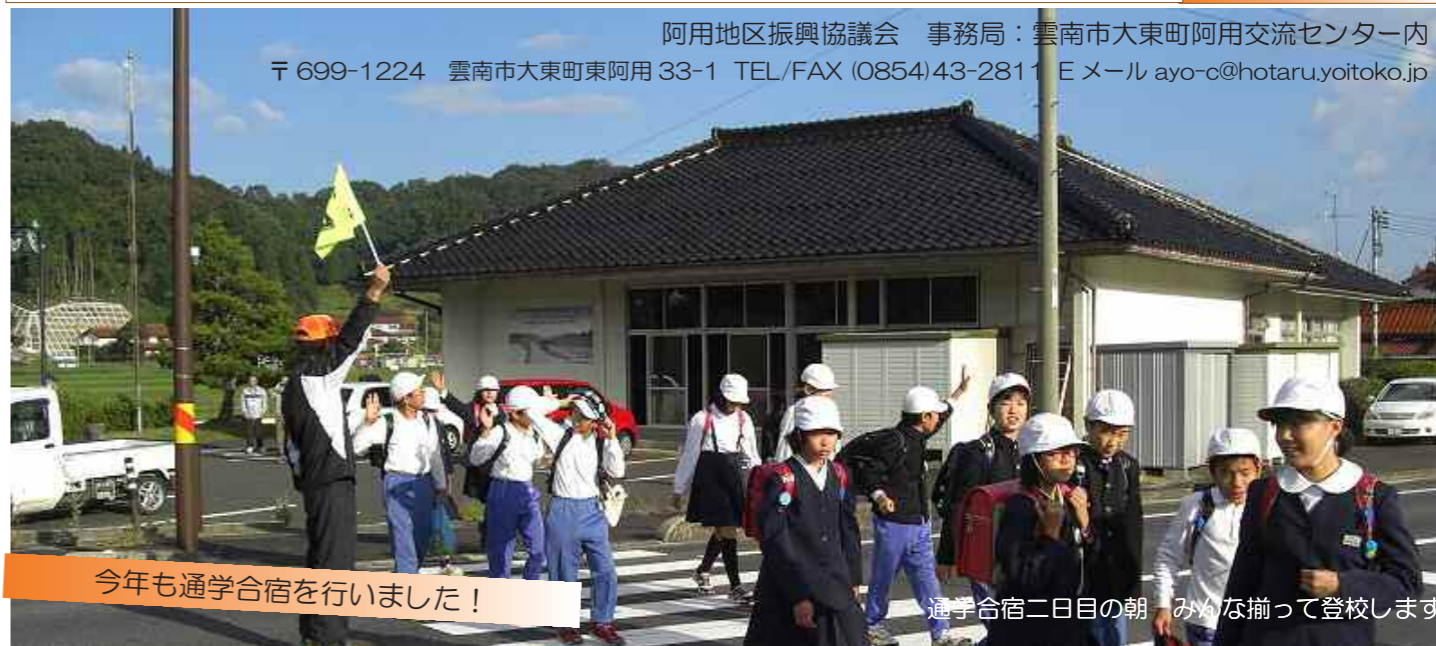
今年も通学合宿を行いました!

阿用地区振興協議会 事務局：雲南市大東町阿用交流センター内 〒699-1224 雲南市大東町東阿用33-1 TEL/FAX (0854)43-2811 Eメール ayo-c@hotmail.com