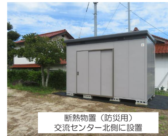
断熱物置（防災用） 交流センター北側に設置