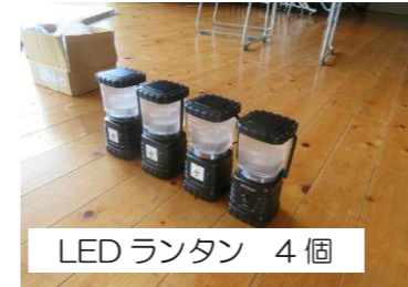
LED ランタン 4個