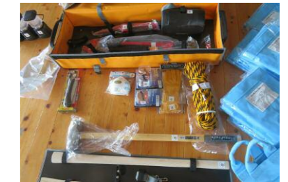
レスキューツールキット