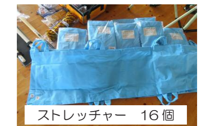
ストレッチャー 16個