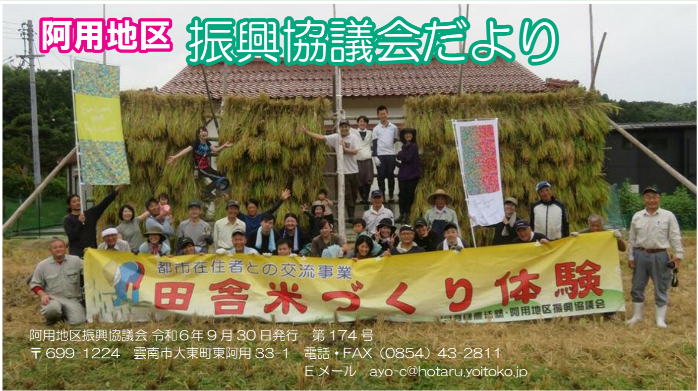
阿用地区振興協議会 令和6年9月30日発行 第174号 〒699-1224 雲南市大東町東阿用33-1 電話・FAX (0854) 43-2811 Eメール ayo-c@hotmail.jp