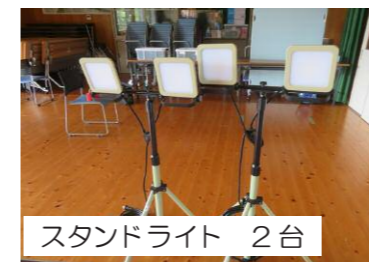
スタンドライト 2台