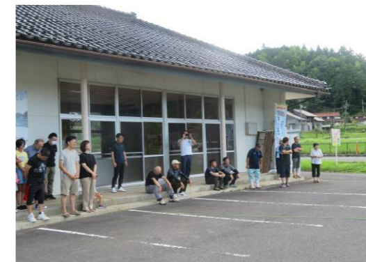
起震車体験の様子です