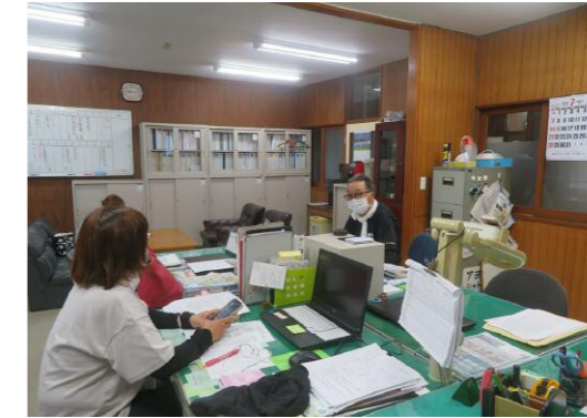
阿用交流センター