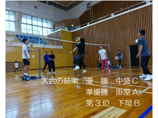
大会の結果 優勝 中盛C 準優勝 掛屋A 第3位 下岡B